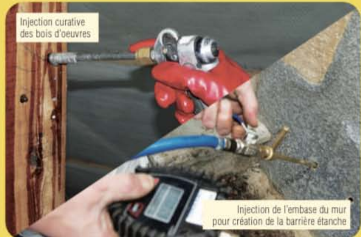
Injection curative des bois d'œuvres