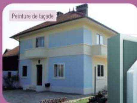
Peinture de façade