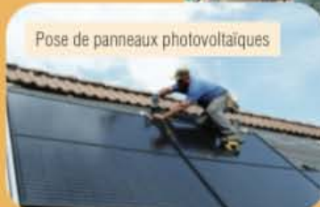
Pose de panneaux photovoltaïques