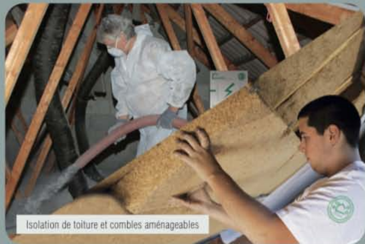
Isolation de toiture et combles aménageables