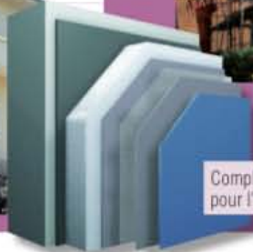
Complexe de doublage pour l'isolation de façade